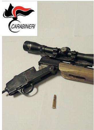
Il fucile trovato a Paoli